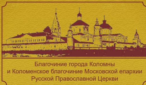
Благочиние города Коломны и Коломенское благочиние Московской епархии Русской Православной Церкви

ГЛАГОЛЬ - ежемесячная интернет-газета благочиний города Коломны и Коломенского округа.