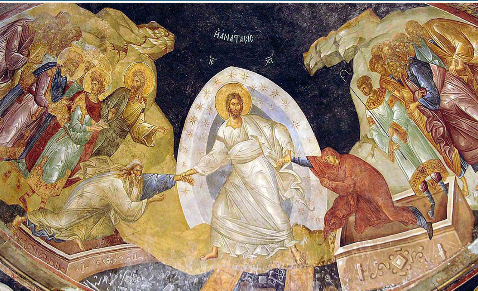
Сошествие Христа во ад. Фреска монастыря Хора, Константинополь. XIV в.

Греческий мастер XIV века - Мануил Паселин изобразил Христа, стоящего на створках врат ада.