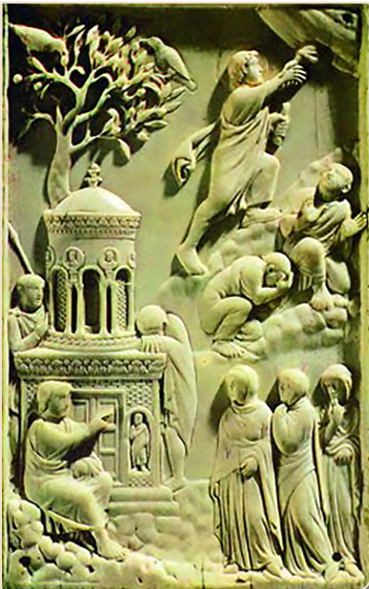
Восстание из Гроба. ок. 400 г. Баварский национальный музей, Мюнхен.

Отдельные сюжеты этой композиции получили дальнейшее развитие и встречаются в более поздних изображениях, но прямых аналогов этой композиции нет. На более поздних изображениях жен мироносиц у гроба Ангел указывает им на лежащую в открытом гробе плащаницу. Изображение Ангела, благовествующего о Воскресении Христовом стоящим у пустого гроба мироносицам, отсылает нас к повествованию евангелиста Матфея: Ангел Господень, сошедший с небес, приступив, отвалил камень от двери гроба и сидел на нем; вид его был, как молния, и одежда его бела, как снег (Мф. 28:2, 3).