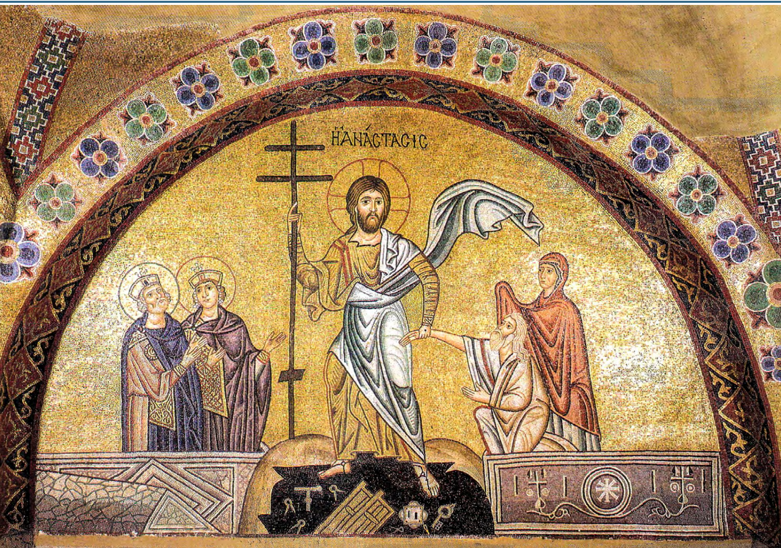
Сошествие во ад. Мозаика из монастыря святого Луки

О Сошествии во ад говорят, например, пророческие тексты Псалтири: Ты вывел из ада душу мою и оживил меня (Пс. 29:4); Апостол Петр в своих посланиях говорит о том, что телесно восстав, Христос сходит во ад для проповеди о Своем Воскресении. (1 Пет. 3:18–19).