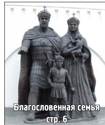
Благословенная семья стр. 6