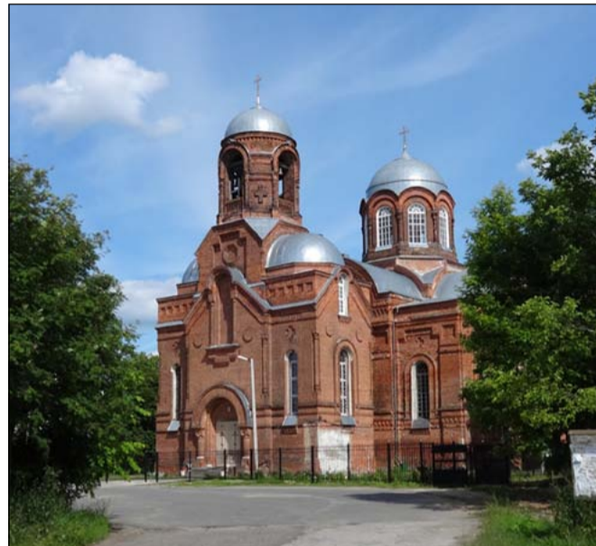
Никольский храм сегодня