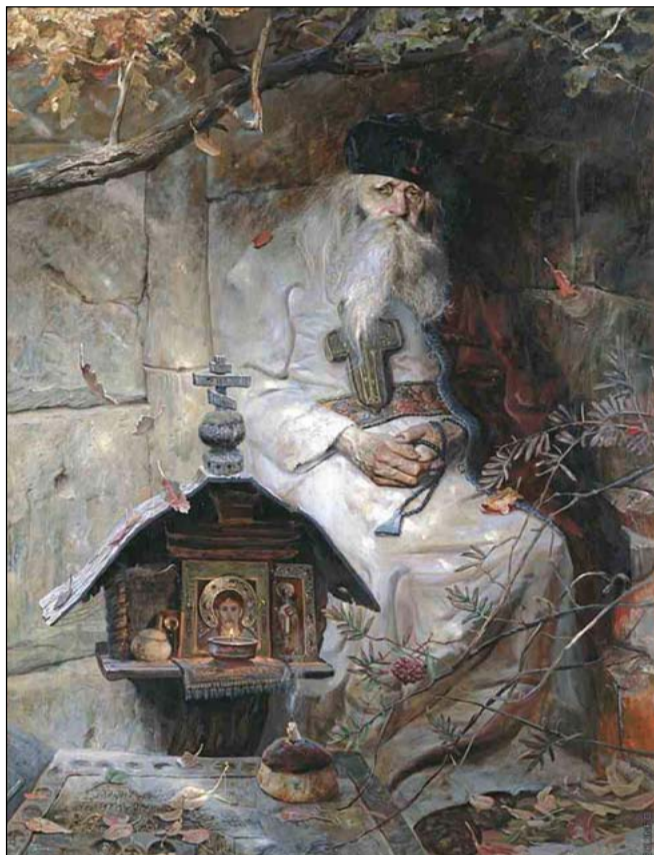
Картина Павла Рыженко

одоры». Тяжкие переживания овладела мной. Ночь почти не спал. Утром, оставив записку, направился на Ярославский вокзал. Я ехал в Загорск, ныне Сергиев Посад, в монастырь, чтобы попасть на приём к старцу и исповедаться за всю жизнь. Исповедь я продумал ночью.