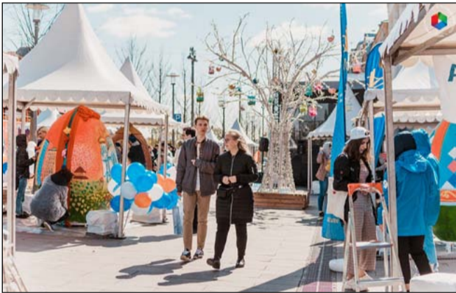
Молодёжный пасхальный фестиваль

28 апреля состоялся первый Московский студенческий Пасхальный фестиваль. Он прошёл у стен Российского православного университета на Новой площади. Главной темой художественной и концертной площадок праздника стало возрождение церковного зодчества в столице.