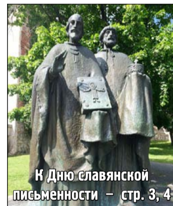
К Дню славянской письменности – стр. 3, 4